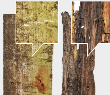
Geacetyleerd Populier *